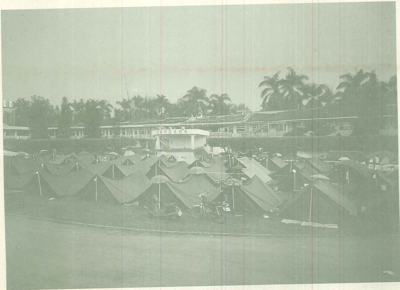
埔里國小。震後災民暫住在帳棚中，生活已長達一個多月之久