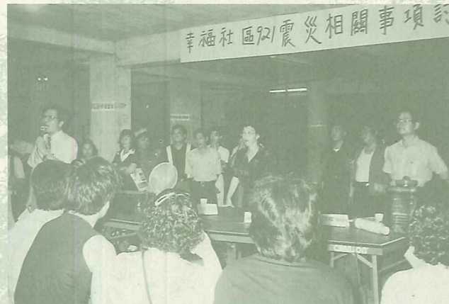
震後幸福社區居民心存餘悸，重建家園將是受災戶迫切的期望

感謝很多公職、縣政府、公所幫忙。十月四日縣長特派縣府吳機要、工務局、社會局、鑑定單位至現場會勘並作「災情說明」，當場表示本社區520