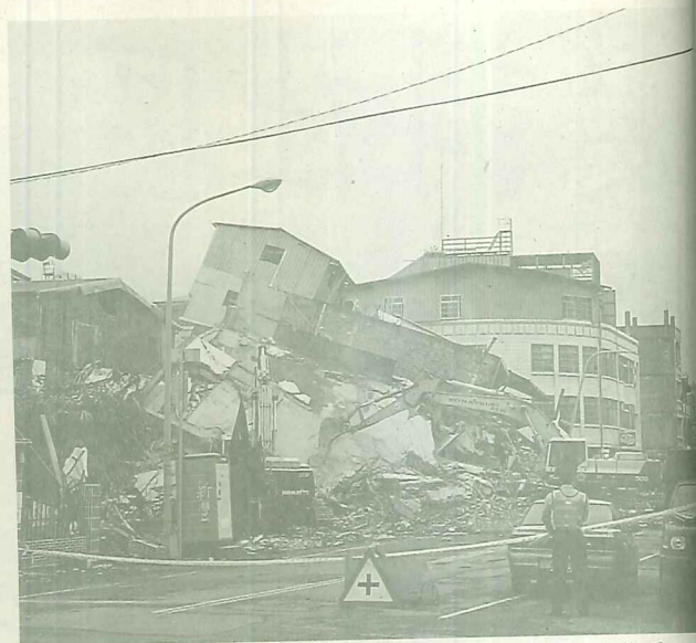
危樓拆除工作如火如荼進行，道路封閉煙霧迷漫，影響民生生活。