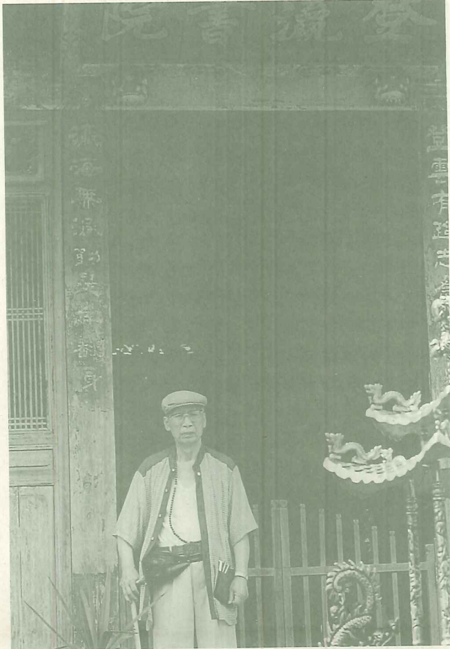
李老師講授漢文，逐句解釋旁徵博引予人印象深刻。